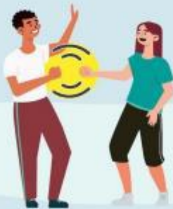
CON EL PUÑO DE LEJOS