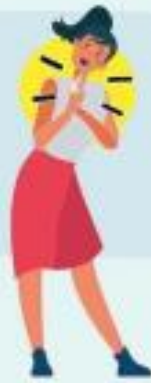
JUNTANDO LAS MANOS