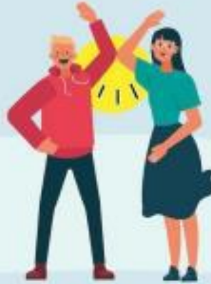
CON EL CODO