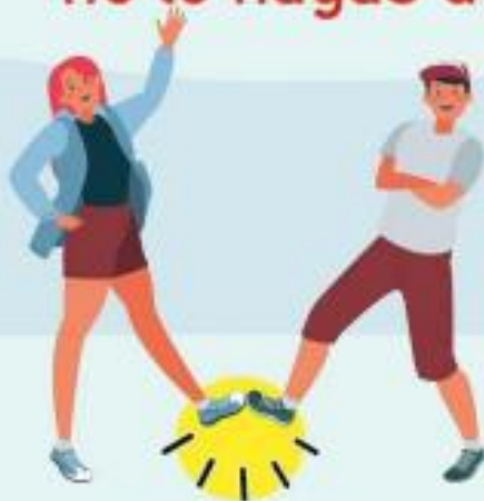
CON EL PIE

Hay otras formas de saludar no lo hagas de mano, beso o abrazo