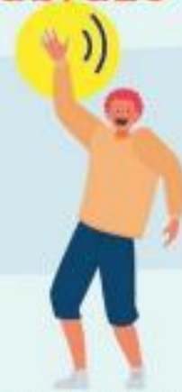
AGITANDO LAS MANOS